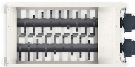
Schneidtable 9 Messer